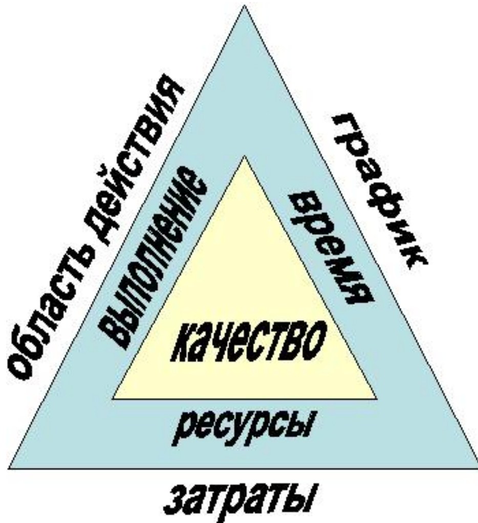
Рисунок 1.1 - Треугольником менеджмента проектов

В ходе осуществления проекта ставится задача поставок продукта с определенной областью действия, стоимость которого остается в заданных пределах, выдерживается определенный график выполнения, а также достигается определенная степень качества.